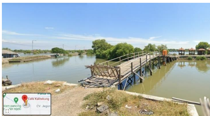
Gambar 4. Rencana Lokasi Spot Foto Cafe Kalitekung