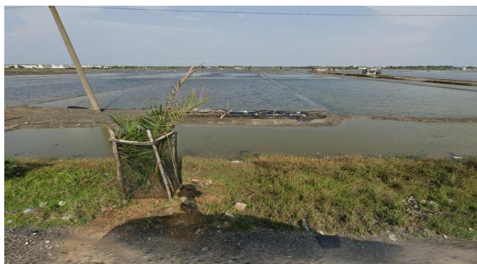
Gambar 3. Rencana Lokasi Ecobrick