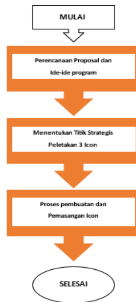
Gambar 1. Flowchart Pelaksanaan Pengabdian Pembuatan 3 Ikon Desa Tambakcemandi

UNUSIDA sejumlah 48 orang. Pada pengabdian ini, rencana dalam pemecahan masalah yang ditemukan adalah pelaksanaan sosialisasi berupa penyuluhan kepada masyarakat dengan memberikan informasi dan motivasi untuk menambah pemahaman masyarakat dalam pengelolaan, pelestarian, dan pemugaran kawasan wisata desa Tambakcemandi sehingga ke depannya masyarakat mampu menghasilkan ide-ide menarik untuk merancang dan membuat fasilitas unik di kawasan wisata pesisir desa Tambakcemandi. Pengabdian ini juga akan membuat plang informasi denah lokasi, ecobrick, dan spot foto. Ikon ini dirancang semenarik mungkin sebagai informasi yang dapat dilihat dan dibaca oleh pengunjung. Gambar atau foto menarik yang mengeksplorasi alam di desa wisata pesisir Tambakcemandi ini juga disusun secara bersamaan sehingga pengunjung dapat melakukan swafoto untuk dipublikasikan di media sosial atau dibagikan kepada sanak saudara dan rekan-rekannya agar proses promosi dapat berkesinambungan dari mulut ke mulut (Purba et al. , 2022). Alur pengabdian masyarakat di desa Tambakcemandi dapat dilihat pada model flow chart di bawah ini