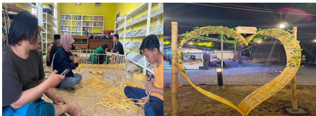
Gambar 8. Menganyam Spot Foto dan Hasil Spot Foto