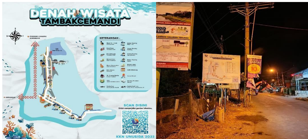
Gambar 5. Desain Denah Wisata dan Hasil Pemasangan Denah