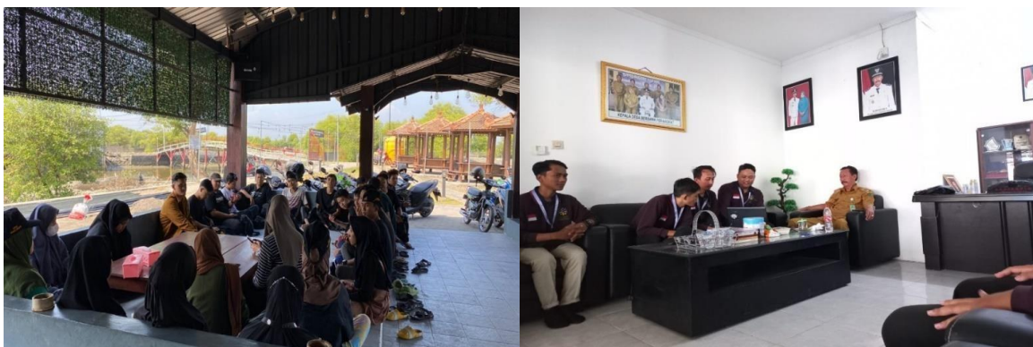
Gambar 1. Rapat Rencana Kegiatan dan Koordinasi dengan Pemerintah Desa

Pada tahap ini, langkah yang dilakukan adalah berkoordinasi dengan pemerintah desa setempat untuk mengatur jadwal kegiatan serta target sasaran potensi kegiatan pembuatan 3 ikon yang akan diangkat. Hasil dari koordinasi tersebut disepakati bahwa ada beberapa objek wisata yang akan menjadi target dalam upaya promosi dan branding Desa Tambakcemandi, yakni Plang denah, Ecobrik dan Spot foto sebagai Icon.