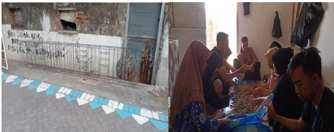
Gambar 6. Kerangka Ecobrick dan Memasukkan Kerang ke Botol Bekas